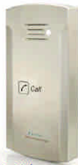
Pantel piezo ref. 3006

Las versiones con cámara integrada permiten además la visualización de la entrada en un monitor de video o desde cualquier PC*