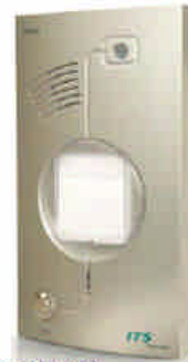
Pantel metal ref. 3012