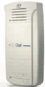
Pantel plástico ref. 3002