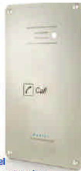
Pantel empotrable piezo ref. 3018