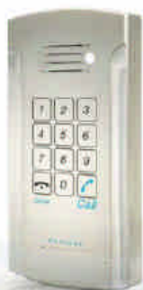
Pancode piezo ref. 3003