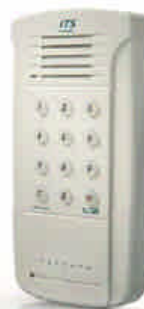
Pancode plástico ref. 3001

* para la visualización en PC es necesario HW adicional