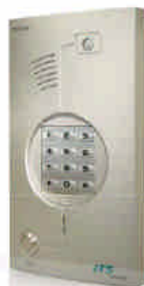
Pancode metal ref. 3009