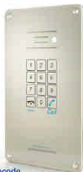
Pancode empotrable piezo ref. 3015